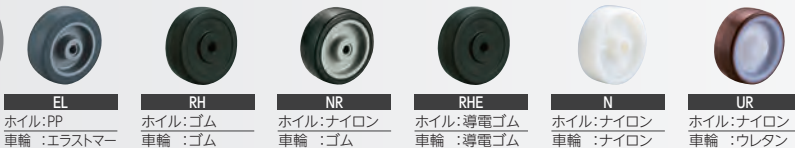
EL: ホイル:PP 車輪:エラストマー RH: ホイル:ゴム 車輪:ゴム NR: ホイル:ナイロン 車輪:ゴム RHE: ホイル:導電ゴム 車輪:導電ゴム N: ホイル:ナイロン 車輪:ナイロン UR: ホイル:ナイロン 車輪:ウレタン