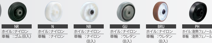
NR ホイル:ナイロン 車輪:ゴム(B入) N ホイル:ナイロン 車輪:ナイロン NB ホイル:ナイロン 車輪:ナイロン(B入) GU ホイル:ナイロン 車輪:ウレタン(B入) BRU ホイル:ナイロン 車輪:ウレタン(B入) PH ホイル:耐熱フェノール 車輪:耐熱フェノール