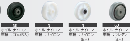
NR ホイル:ナイロン 車輪:ゴム(B入) N ホイル:ナイロン 車輪:ナイロン N ホイル:ナイロン 車輪:ナイロン(B入) GU ホイル:ナイロン 車輪:ウレタン(B入)