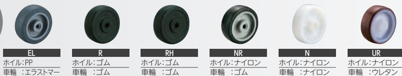
EL: ホイル:PP 車輪:エラストマー R: ホイル:ゴム 車輪:ゴム RH: ホイル:ゴム 車輪:ゴム NR: ホイル:ナイロン 車輪:ゴム N: ホイル:ナイロン 車輪:ナイロン UR: ホイル:ナイロン 車輪:ウレタン