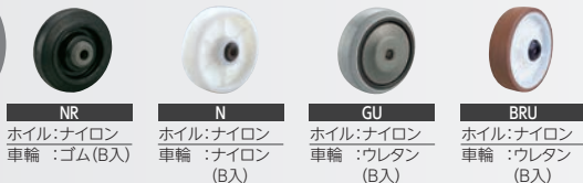
NR ホイル:ナイロン 車輪:ゴム(B入) N ホイル:ナイロン 車輪:ナイロン(B入) GU ホイル:ナイロン 車輪:ウレタン(B入) BRU ホイル:ナイロン 車輪:ウレタン(B入)