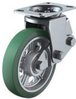
SKY-2R200AW (AR) Gr-A-1